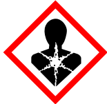
GHS08 Danger pour la santé