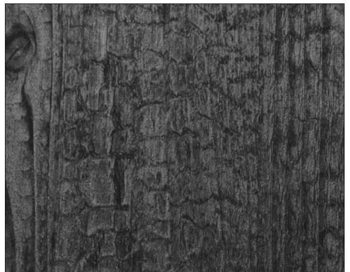
WL Carbonized Wood