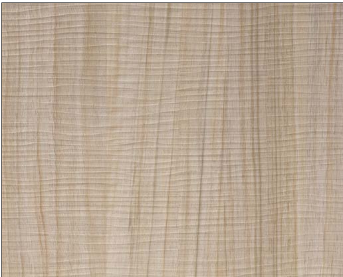
WL Maple Alpine

Not only visually, but also haptically an experience. Innovative manufacturing processes allow a particularly lively wood structure and resource-saving use of raw materials.