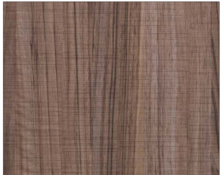
WL Nutwood Country