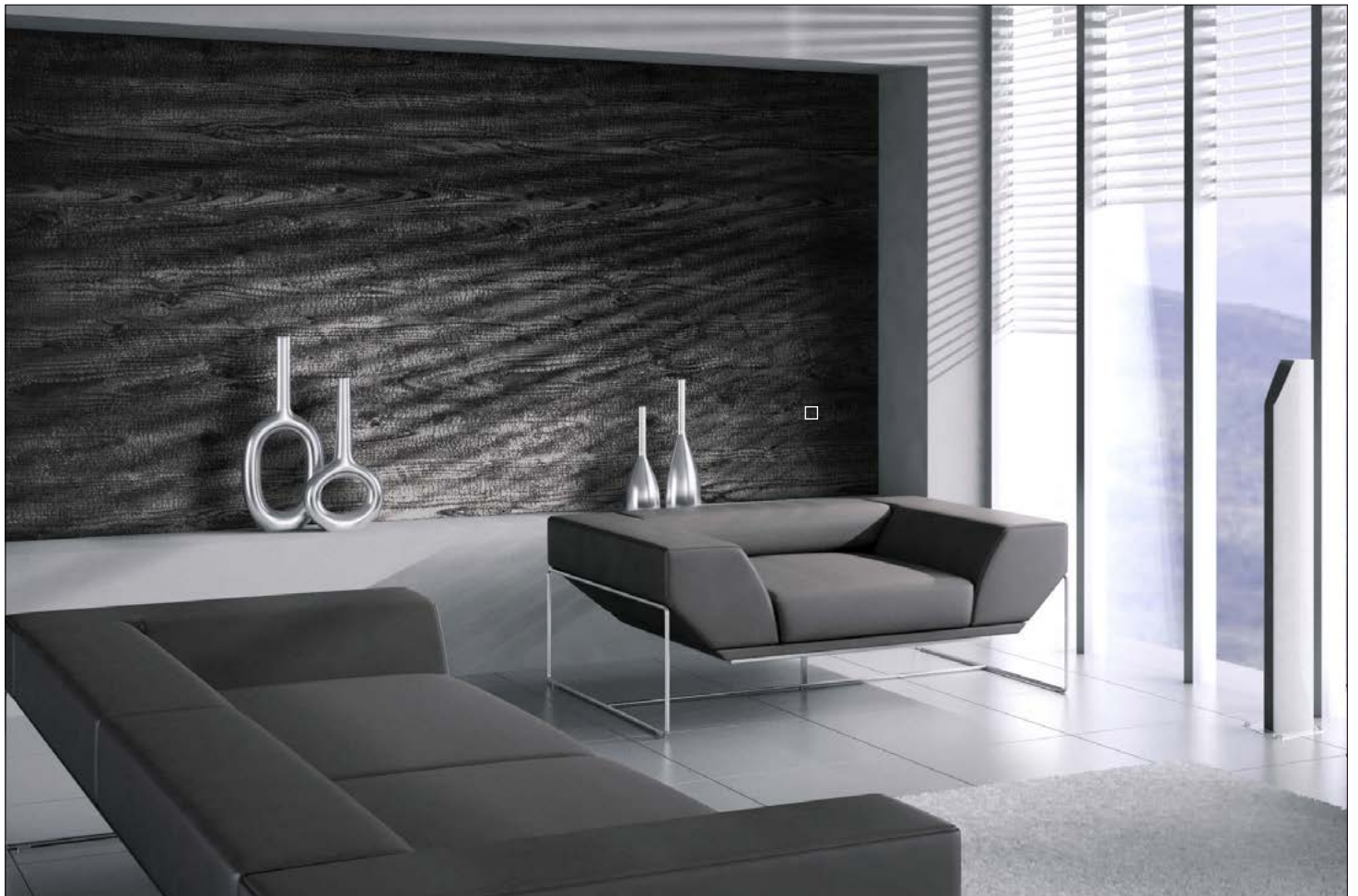
□ WL Carbonized Wood