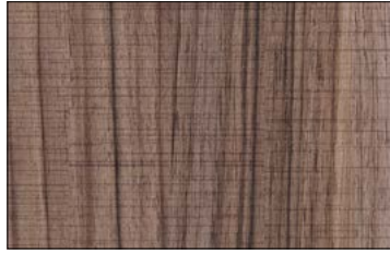
WL Nutwood Country