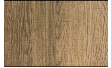
WL Sessile OAK