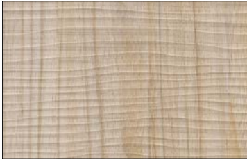
WL Maple Alpine