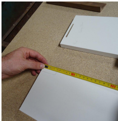
Prise de mesure exacte pour le positionnement des poignées