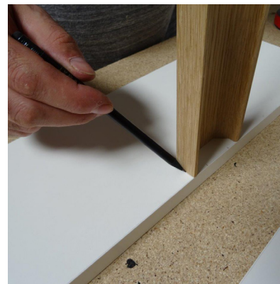
Tracé de l'emplacement des poignées