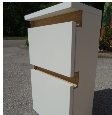
Vue du caisson avec les poignées encastrées en L, en C et avec des embouts sur un seul côté de caisson. Dernière actualisation : 08/2020