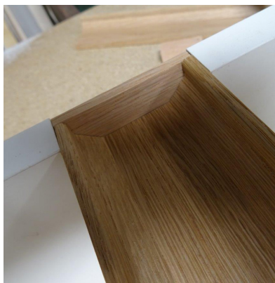
Vue intérieure : poignée encastrée avec embout