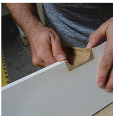
Vérification de l'emplacement de la poignée