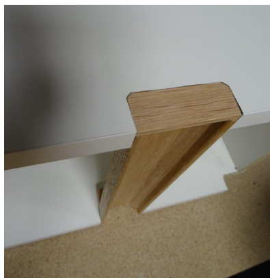
Pålimning af endekapper - udvendigt