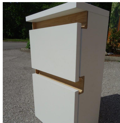
Færdigt korpus med egetræsgreb L+C profil og afslutning i den ene side