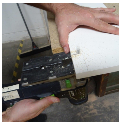
Ausschneiden aus Seitenteil des Korpus